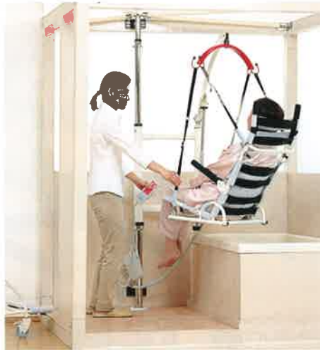
※画像は、安楽キャリーBタイプ(分離型)を使用した場合です。

脱衣室から浴室へ移動するときは、2関節タイプがお勧めです。狭い入り口からの出入りがとてもスムーズで、トイレでも使用可能。